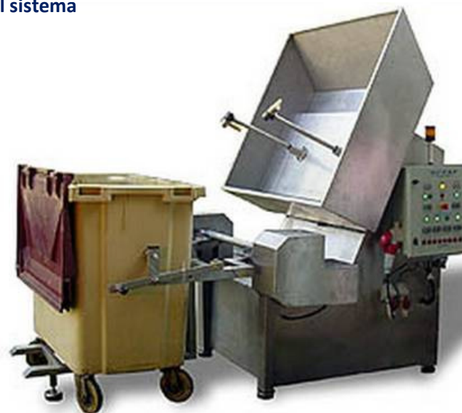
Detalle del sistema

* NOTA: Los equipos auxiliares (máquina agua a presión y generador de vapor) no se incluyen en el equipamiento de serie.