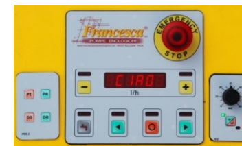
Panel digital programable