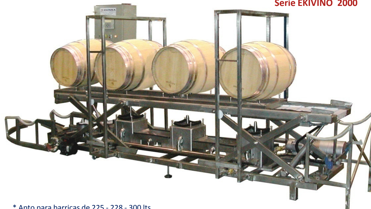
Serie EKIVINO 2000

* Dependiendo de las opciones escogidas en la máquina, es posible necesitar más de una hidrolavadora. Los equipos auxiliares no están incluidos.