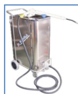
Opción de Vapor