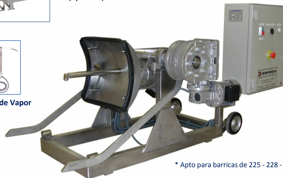
Serie EKIVINO 800

* Apto para barricas de 225 - 228 - 300 lts.