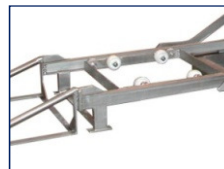
Detalle del CARRO GUÍA (opcional)

* NOTA: Los equipos auxiliares (máquina agua a presión y generador de vapor) no se incluyen en el equipamiento de serie.