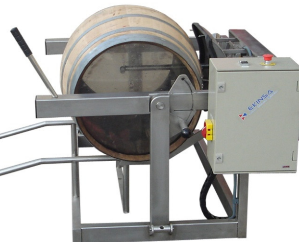
Serie EKIVINO 800

* Apto para barricas de 225 - 228 - 300 lts.