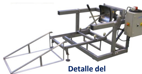
Detalle del CARRO GUÍA y RAMPA

* NOTA: Los equipos auxiliares (máquina agua a presión y generador de vapor) no se incluyen en el equipamiento de serie.