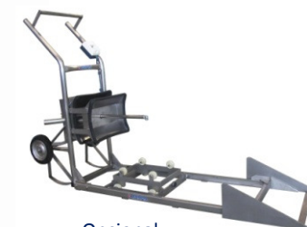
Opcional: Carro guía