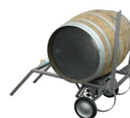
Posición de lavado