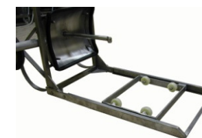
+ Carro guía opcional

* Apto para barricas de 225 – 228 – 300 lts.